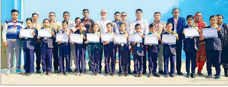
तोशाम। अतिथियों के साथ आदर्श इंस्टीट्यूट केरू के विजेता विद्यार्थी।

इसमें बाढ़ड़ा विधानसभा के चांदवास, तोशाम खेल स्टेडियम, अटेली विधानसभा के गांव दोगड़ा अहीर खेल स्टेडियम में, महेंद्रगढ़ विधानसभा के आरपीएस कॉलेज बलाना, नारनौल विधानसभा के