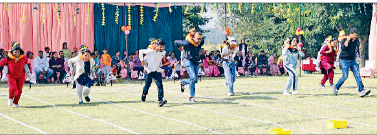
मिवानी। अपने बच्चे को पीट पर उठाकर दौड़ते अभिभावक।