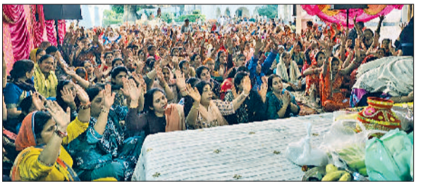
मिवानी। श्रीमद्भागवत कृष्ण कथा का श्रवण करते श्रद्धालु।