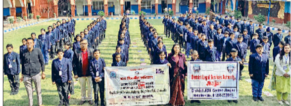
चरखी दादरी। मोबाइल का आवश्यक उपयोग छोड़ने की शपथ लेते विद्यार्थी।