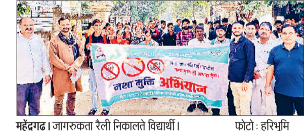
महेंद्रगढ़। जागरूकता रैली निकालते विद्यार्थी।