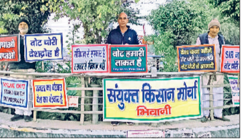
हरिभूमि न्यूज ►► मिवानी