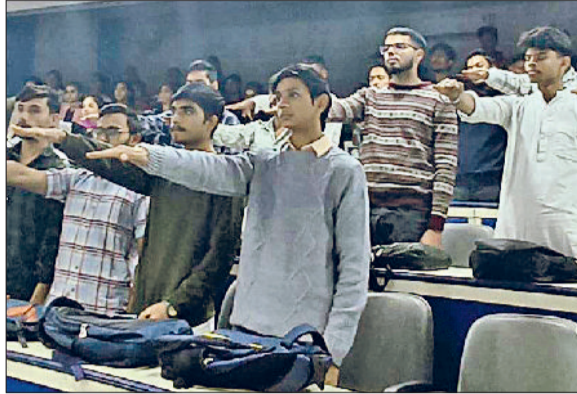
चरखी दादरी के जनता महाविद्यालय में नशा मुक्ति की शपथ लेते विद्यार्थी।